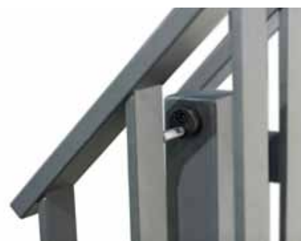
Nieuwe traphekbevestiging voor lamellenhekken