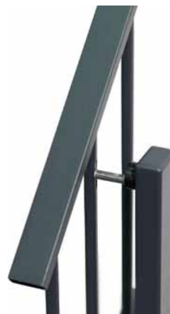
Nieuwe traphekbevestiging voor spijlenhekken